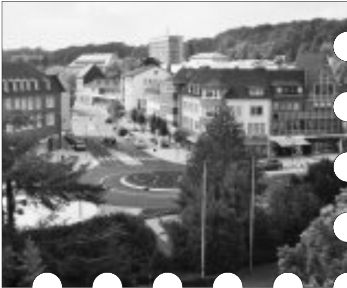
Geilenkirchen Stadtmitte mit neuem Kreisverkehr