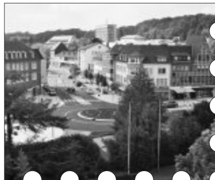
Geilenkirchen Stadtmitte mit neuem Kreisverkehr